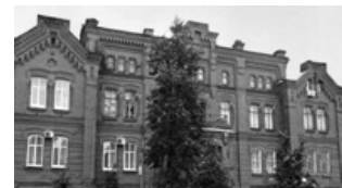
г. Пермь, ул. Коммунистическая, д. 23

кандидат экономических наук, Пермская ГСХА