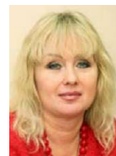
625003 г. Тюмень, ул. Республики, 7; тел. 8 (3452) 62-56-09

уровня продовольственной самообеспеченности с использованием государственных программ субсидирования фермеров и мер импортного контроля для защиты местных производителей от иностранной конкуренции. При этом поддержание цен в сельском хозяйстве на определенном уровне ложится достаточно тяжелым бременем и на государство, и на налогоплательщиков. Но именно стабильность цен является для этих стран средством обеспечения продовольственной безопасности. В качестве примера следует назвать Японию и Швейцарию, где цены на продовольствие выше мировых (например, в Японии государство покупает и продает рис внутри страны по ценам, превышающим мировые в 6-8 раз; оптовая цена на сахар во Франции в 1997 г составила 1000-1200 долл. США, а мировая - 350 долл.; мировая цена за 1 ц сливочного масла - 110 экю, внутренняя - 270 экю). При этом население понимает все негативные последствия снижения цен для сельского хозяйства и для национальной экономики, а потому "смирилось" с подобным положением дел. Позиция Европейского Сообщества в этом вопросе, по мнению экспертов Комиссии европейских сообществ (КЕС), заключается в том, что "продовольственная безопасность любой страны почти так же важна, как ее воен-